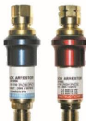
DS 1000R/L takaiskusuojat